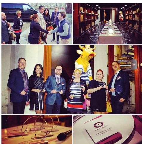
Bordeaux, 2 Aprile: Premiazioni Wine Blog Awards 2017

La mia vita, da sempre, è stata un balletto barocco tra le varie materie. Dalla danza classica ho imparato la disciplina, dal tennis il gusto per la sfida, dal Liceo Artistico l'amore per il disegno a mano libera e l'arte tutta, dall'ingegneria l'analisi e il ragionamento, dall'Associazione Italiana Sommelier la capacità di dare un nome ad una sensazione organolettica. Amo scrivere ed alle spalle ho oltre una decina di premi letterari vinti. Inesauribile vulcano di idee, colleziono orchidee e spumanti di ogni parte del mondo. Grazie alla mia preparazione poliedrica, nella vita ho potuto spaziare in vari settori, della fotografia al design, del visual merchandising all'architettura, dal giornalismo al web, seguendo anche progetti per importanti clienti di ogni parte del mondo.